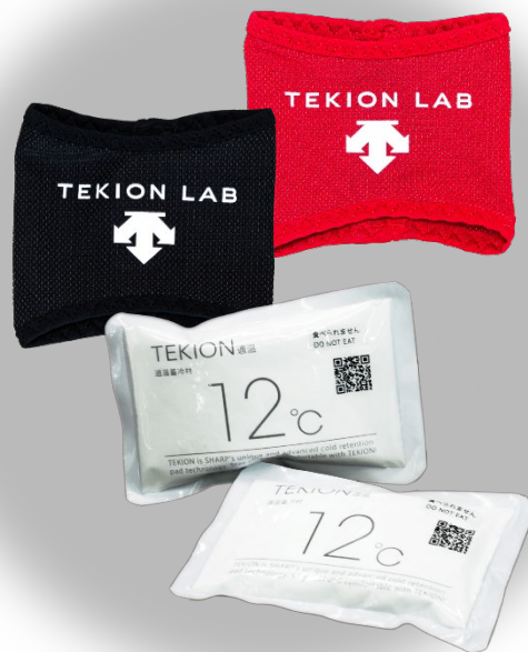
液晶材料技術が 生み出し適温蓄冷材を応用 CORE COOLER