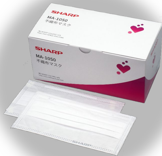
液晶工場の クリーンルームで生産する 国産不織布マスク