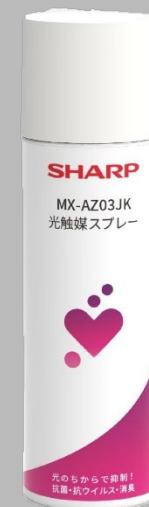
複写機トナーの 材料技術が生み出した 可視光 光触媒スプレー