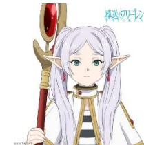
葬送のフリーレン